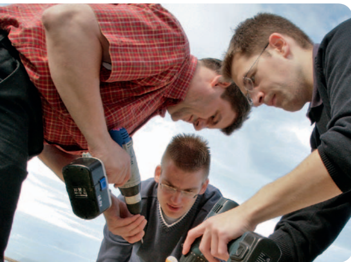
Anpacken für den guten Zweck: Teamworker bei der freiwilligen Arbeit.