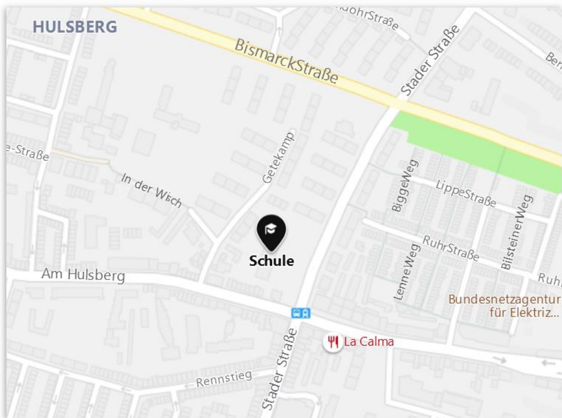
Grundschule Stader Straße 150, 28205 Bremen